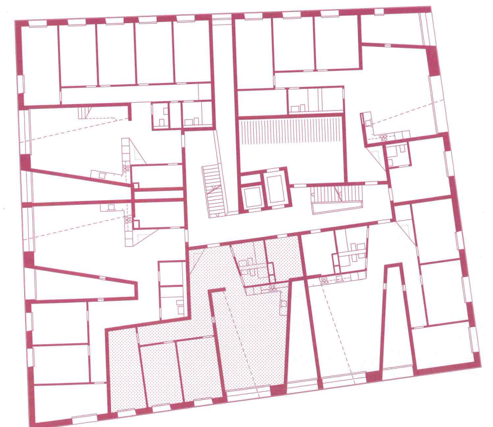
4,5-ZI-WHG, GEBÄUDE AM PLATZ (POOL ARCHITEKTEN) 0 1 2