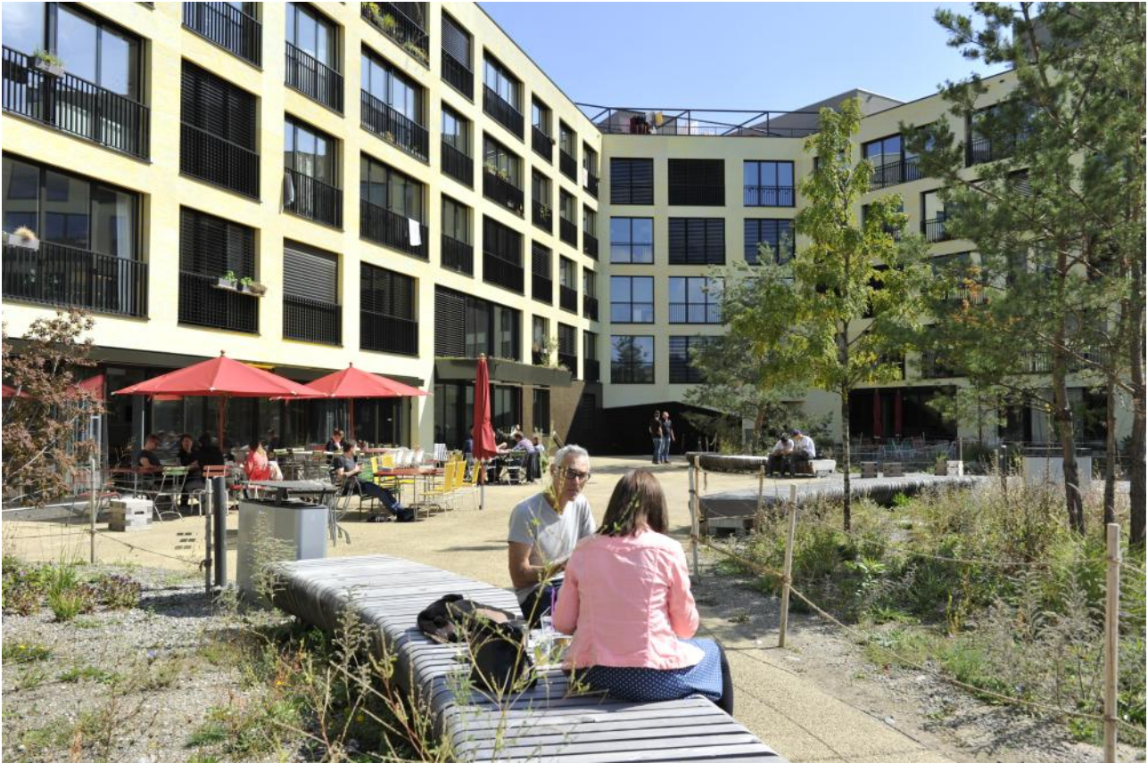
Eine Art Dörfli im städtischen Umfeld: Im Innenhof der «Kalki».

Ein Blick in eine alte Genossenschaftswohnung aus der Mitte des letzten Jahrhunderts zeigt die damals vorherrschenden Familienstrukturen. Einer Familie genügten seinerzeit drei Räume: Eltern-, Kinder- und Wohnzimmer. Hinzu kamen das Bad und die in der Regel winzige Küche. Alles war sauber getrennt: dort der Bereich der Eltern, da jener der Kinder.